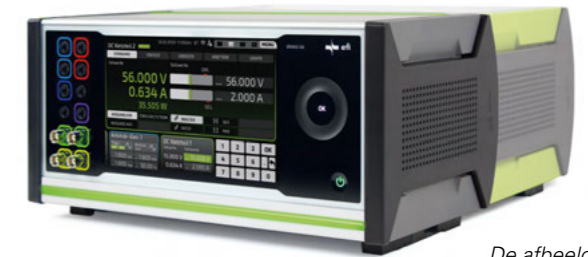
De afbeelding toont twee bouwdieptes