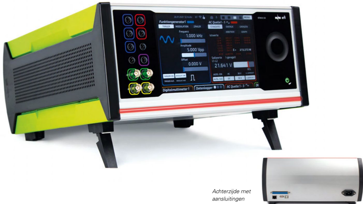
Achterzijde met aansluitingen

De toestellenseries elneos six , basic en highlab kunnen met een hoogwaardig geanodiseerd aluminium extrusieprofiel overal als desktop toestel worden gebruikt. Door middel van een professionele 19" opnametechnologie, kunnen 3 HE-toestellen optimaal geïntegreerd worden.