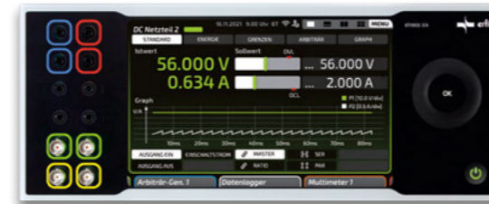
Toestel als 19" plug in unit

De toestellen kunnen gebruiksklaar worden geleverd als 19" plug in units voor integratie in uw labtafel of als stand-alone toestel in een tafelbehuizing.