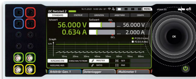
Afb. 2: elneos six met 8" beeldscherm en Airwheel met tactiele feedback

Een volledig nieuw ontwikkelde aansluitbussenverlichting met verdwijneffect visualiseert nu voor het eerst veiligheidsrelevante vermogensuitgangen voor alle toestelgroepen, inclusief de nieuwe toestelgroepen voor hoog stroom voedingen en AC-voedingen. Op deze manier worden gebruikers veilig begeleid en kunnen ze de toestelfuncties onmiddellijk herkennen. Verschillende en veiligheidsrelevante toestelfuncties zijn voorzien van een kleurcodering en begeleiden de gebruiker veilig bij alle aansluitwerkzaamheden (Afb. 4).