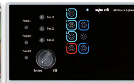
Afb. 7: elneos six aansluitbussenverlichting van de AC voedingen