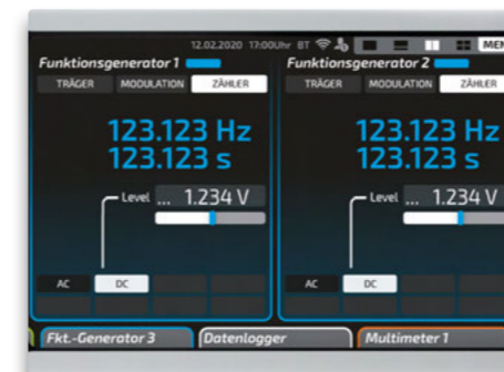
Afb. 5: elneos six in halfscreen modus