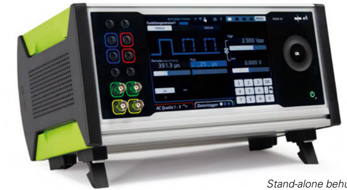
Stand-alone behuizing met diepte van 185 mm