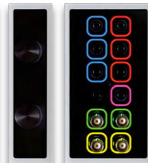
Afb. 4: Intelligente aansluitbussenverlichting