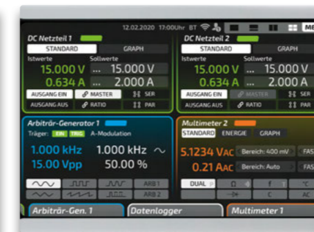
Afb. 6: elneos six in quattro screen modus